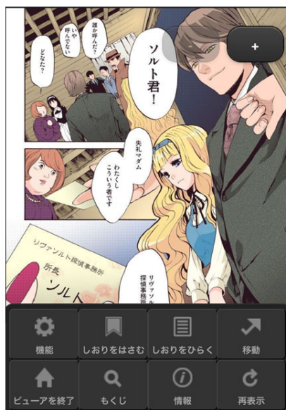
UIやデザインを自由にカスタマイズ可能