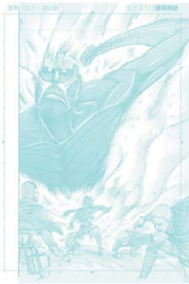
なぞるだけ原稿用紙