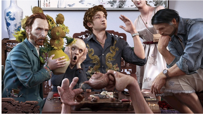
CG アート作品公募部門 作者:YuSun