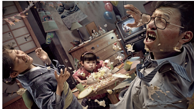
CG アート作品公募部門 作者:zerozhang

「ASIAGRAPH 2014 in Tokyo」の会場において、応募作品の展示の他、CLIP STUDIO PAINT を使用したキッズ向けのイラスト体験コーナーや、プロのクリエイターによるライブドローイングをセルシスと ASIAGRAPH が共同で開催いたしました。