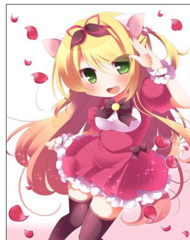
作画・文:林檎ゆゆ