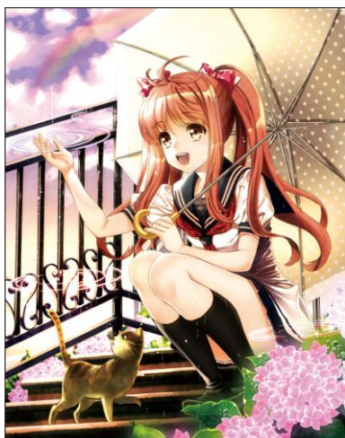
作画・文:天神うめまる